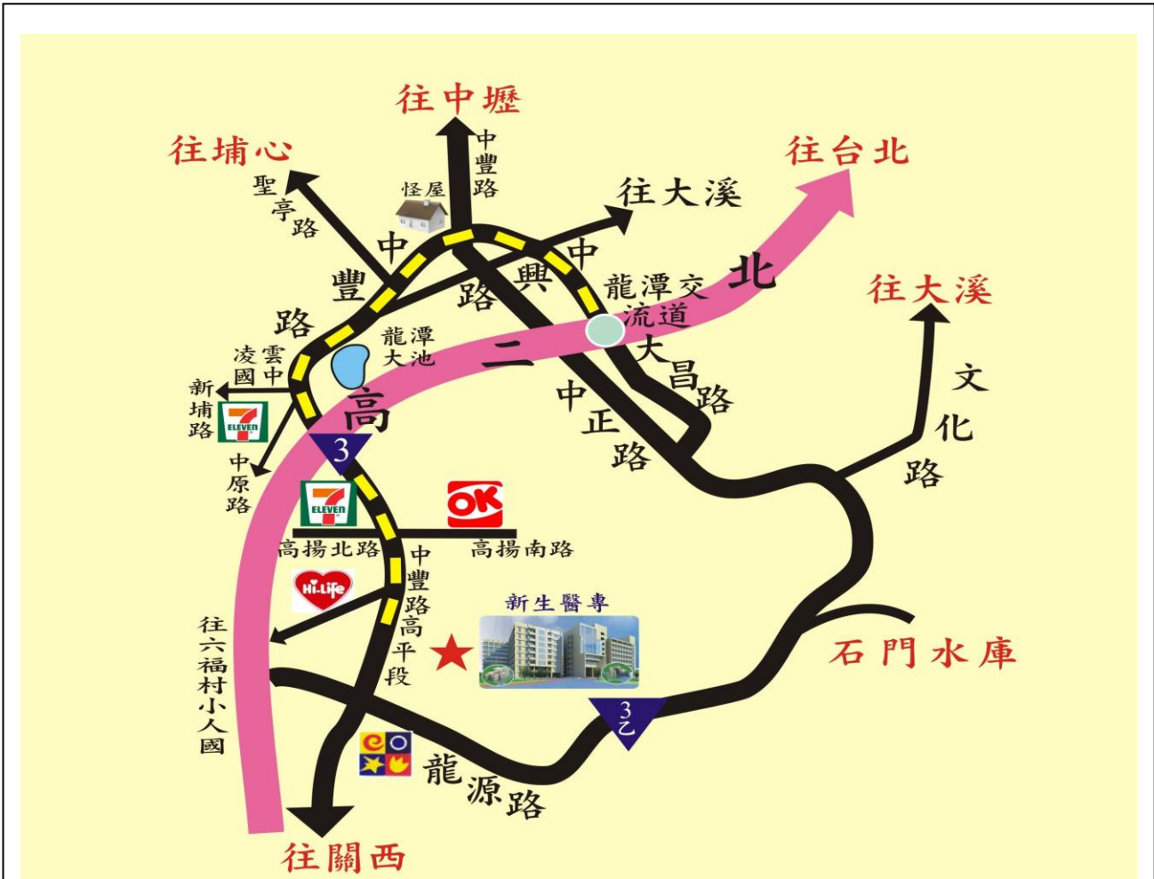
新生醫護管理專科學校新校區位置圖 325桃園縣龍潭鄉中豐路高平段418號